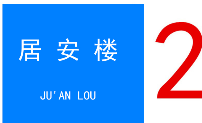
图2 住宅小区楼号（栋号）标识标志设置样式（参考）